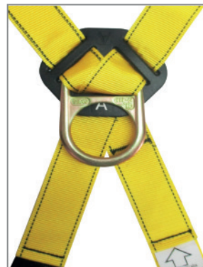
VISTA POSTERIOR ANILLA DORSAL