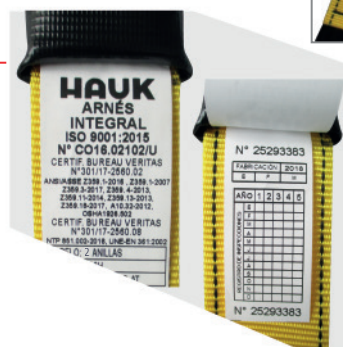
IDENTIFICACIÓN Y TRAZABILIDAD