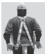
3. Colóquese el arnés como si fuera un chaleco; la anilla "D" debe quedar en la espalda y al centro de los hombros.