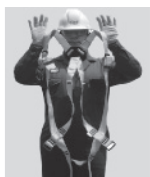
2. Sostenga el arnés de las correas de los hombros.