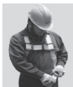
2. Abroche las correas que cuelgan a la altura de las piernas.