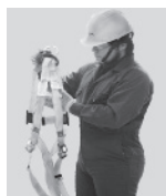
1. Tómelo de la anilla "D" que se encuentra entre las etiquetas de marca y las instrucciones