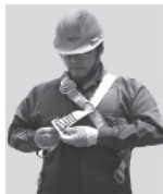
2. Abroche la hebilla que está a la altura de la cadera.