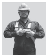
1. Abroche la hebilla que queda a la altura del pecho.