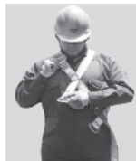
1. Abroche la hebilla que queda a la altura del pecho.