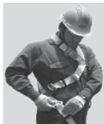
3. Abroche las hebillas que cuelgan a la altura de las piernas y proceda a regular.