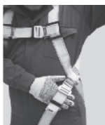
3. Regule todas las hebillas de tal forma que quepa una mano apretada entre la ropa y las correas.