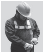
2. Abroche las correas que cuelgan a la altura de las piernas.