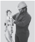
1. Tómelo de la anilla "D" que se encuentra entre las etiquetas de marca y las instrucciones