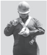
1. Abroche la hebilla que queda a la altura del pecho.