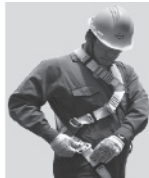
3. Abroche las hebillas que cuelgan a la altura de las piernas y proceda a regular.