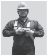
1. Abroche la hebilla que queda a la altura del pecho.