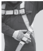
3. Regule todas las hebillas de tal forma que quepa una mano apretada entre la ropa y las correas.