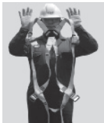
2. Sostenga el arnés de las correas de los hombros.