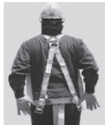
3. Colóquese el arnés como si fuera un chaleco; la anilla "D" debe quedar en la espalda y al centro de los hombros.