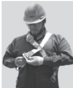
2. Abroche la hebilla que está a la altura de la cadera.